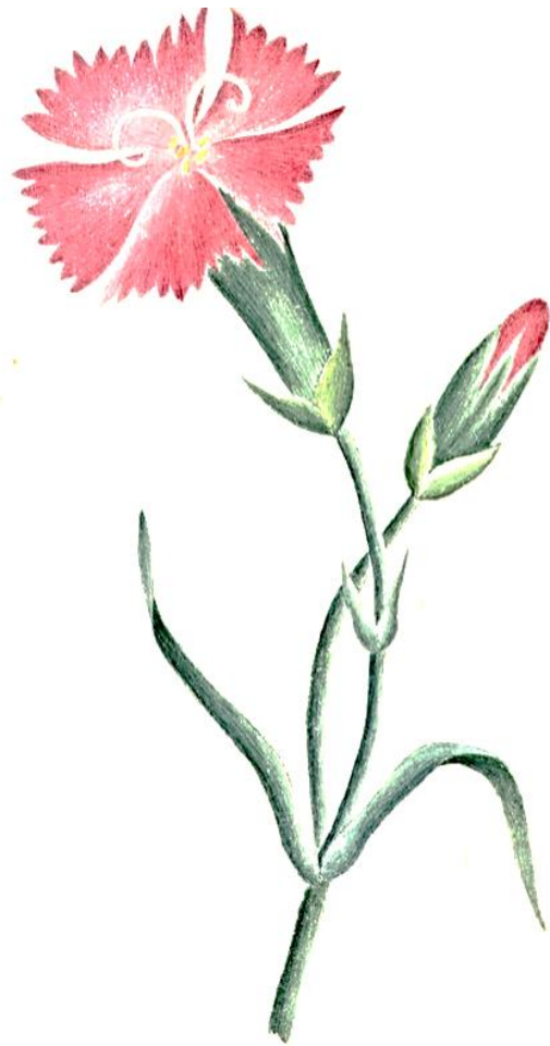
Dianthus sp., * K_{(5)} C_5 A_{5+5} G_{(2)}

Taksonomski markeri porodice: cvjetovi aktinomorfni, heterohlamidni, uglavnom pentamerni, hori- ili sinsepalni, prašnika uglavnom 10, plodnica nadrasla, vratova od 2-5, plod uglavnom tipa čaure, otvara se zupcima, listovi cijeli, naspramni.