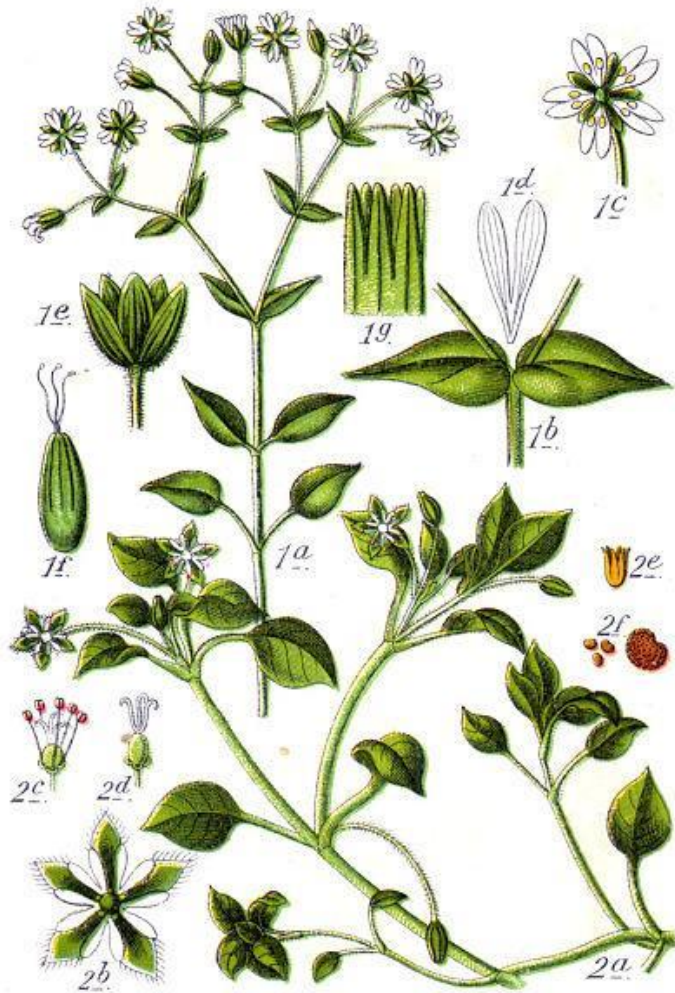
Stellaria media , *K 5 C 5 A 5+5 G (3)

Zadatak: Na crtežima/fotografijama su prikazani odabrani predstavnici porodice karanfila. Posmatrati formu rasta, oblik i raspored listova, građu cvijeta. Na osnovu liste ključnih taksonomskih markera odrediti biljke po ključu, bilježeći redne brojeve odabranih teza/antiteza.