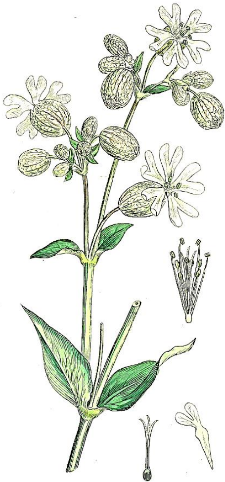
Silene vulgaris , * K_{(5)} C_5 A_{5+5} G_{(5)}