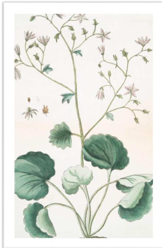
Saxifraga rotundifolia *K5 C5 A 10 G (2)